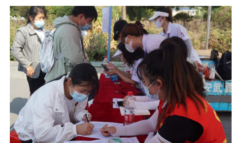
▲志愿者们在车站接待新生们

为方便新生报到，学校在黄石火车站、黄石北站、大冶北站以及黄石综合客运枢纽设置校外迎新点，人力资源部、学工部老师带领志愿者进行搭帐篷、搬桌子等一系列迎新准备工作，安排专车专人接送报道新生。