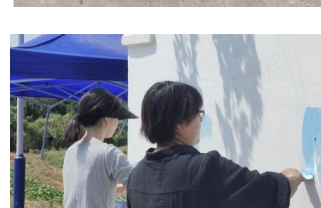
▲文理学子们现场绘图