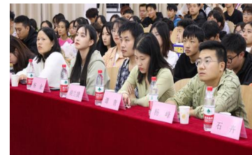
▲各教学单位指导老师

本次“新生杯”篮球比赛启动仪式圆满结束。篮球是力量的角逐，智慧的较量，也是各位同学展示自我的舞台，愿各支队伍在接下来的比赛中取得优异的成绩，用手中的篮球，舞动生命的精彩。