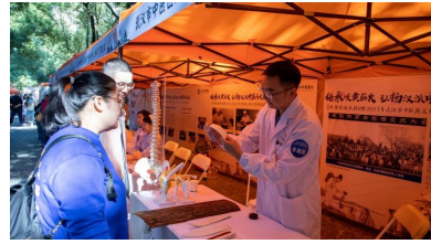
▲传统医药非遗展示和体验区

(来源：人民日报) 10月21日上午，首届“世界传统医药日暨2023年武汉市中医药文化宣传周活动”启动仪式在江岸区黎黄陂路开幕。本届文化宣传周活动从10月21日开始，至10月27日结束，旨在提升居民中医药健康素养，营造浓厚的中医药发展氛围，打响“汉派”中医药文化品牌，推动全市中医药高质量发展。