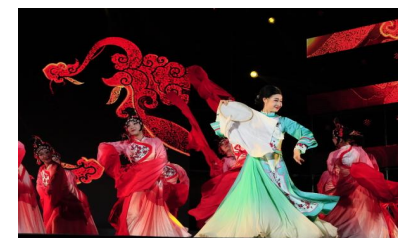
▲女子舞蹈《灵绣疏影》

党有号召，团有行动。我校开展此次主题团日活动，进一步引导广大文理学子认真学习领会习近平新时代中国特色社会主义思想精神内涵，切实肩负起新时代新征程的使命任务，在中国式现代化建设中挺膺担当。